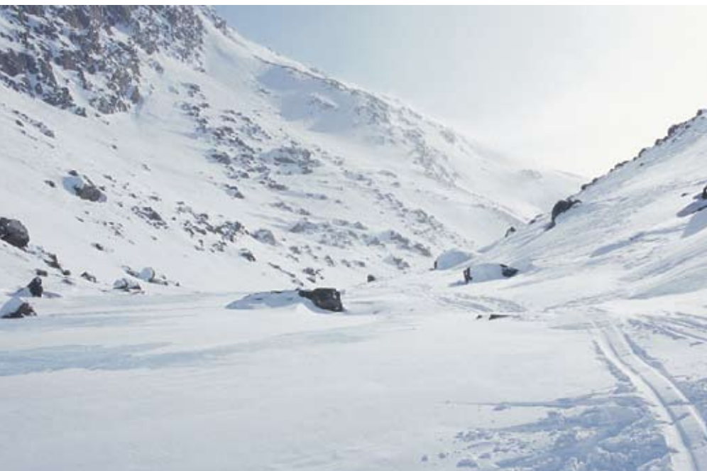
Dolina polodowcowa prowadząca ku zatoce Camberland Sound

Następnego dnia temperatura nieznacznie się podniosła, choć wiatr nadal wiał. Po drodze spotykaliśmy kolejnych Eskimosów, którzy udawali się na polowanie, oraz pierwszy raz spostrzegłem ślady karibu. Wieczorem, kiedy dochodziliśmy do chaty myśliwskiej, w której zamierzaliśmy spędzić piąty nocleg na Baffin Island, zatrzymali się przy nas powracający z polowania Eskimosi. Mieli kilka sztuk karibu i skórę z wilka. Po krótkiej rozmowie ruszyliśmy dalej i zanim zapadł zmrok, leżeliśmy już w śpiworach po obfitej kolacji w chacie myśliwskiej. Nieopodal niej stały dwa porzucone skutery. Jak się potem dowiedzieliśmy od Eskimosów, skutery często się psują, a naprawienie ich w niskiej temperaturze jest niemal niemożliwe. Eskimosi podróżują przeważnie, w co najmniej dwa skutery, aby w razie awarii jednego przesiąść na drugi sprawny, pozostawiając uszkodzony na szlaku. Dodatkowo każdy z myśliwych ma radio UKF i przed wyruszeniem w trasę powiadamia wszystkich o swoim wyjeździe. Jeśli po drodze zepsuje mu się skuter, a jedzie sam, może przez radio wezwać pomocy. Takie pozostawione w tundrze skutery czasem są ściągane przez właścicieli, ale jak zaobserwowaliśmy, przemierzając trasę naszej wyprawy, dzieje się to jednak rzadko.