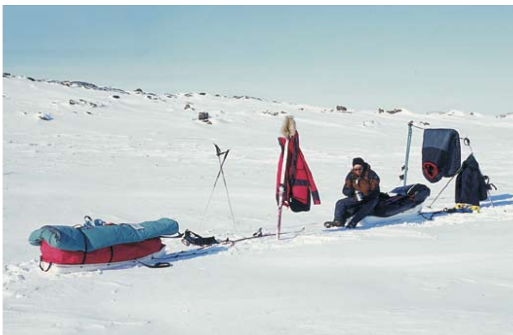
Wypoczynek podczas marszu