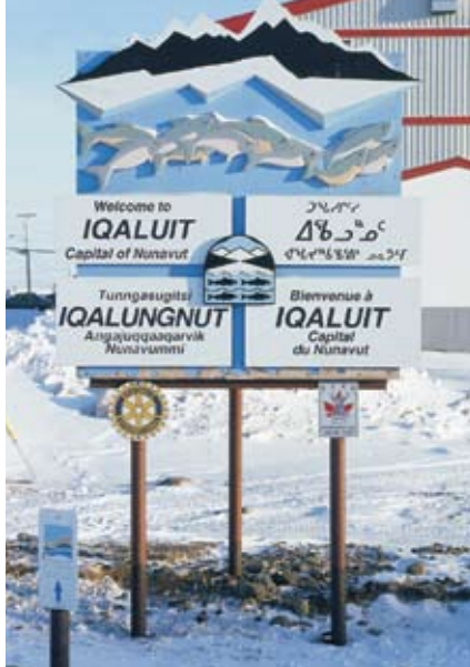
Tablica witająca turystów w Nunavut ustawiona przy lotnisku w Iqaluit

Następnego dnia, aby wyruszyć na trasę zgodnie z planem, wstaliśmy już o piątej. Zagotowanie wody na herbatę do termosu oraz na śniadanie, które składało się z musli, zajmowało nam niemal godzinę. Dodatkowo pół godziny poświęciliśmy na zjedzenie śniadania. Zwinięcie namiotu i zapakowanie sań to kolejne pół godziny. Jednak w miarę upływu dni udało się czas składania obozu skrócić do niespełna półtorej godziny. Zgodnie z zamierzeniem o siódmej byliśmy już w drodze. Pogoda była bardzo ładna, a temperatura nie spadała poniżej -10 stopni Celsjusza. Przed południem dotarliśmy w końcu do szlaku, który jest uczęszczany przez myśliwych podróżujących na skuterach, dzięki czemu znaczą go nie tylko tyczki i lnukszuki, czyli kamienie ułożone jedne na drugich, ale także dobrze widoczne ślady skuterów.