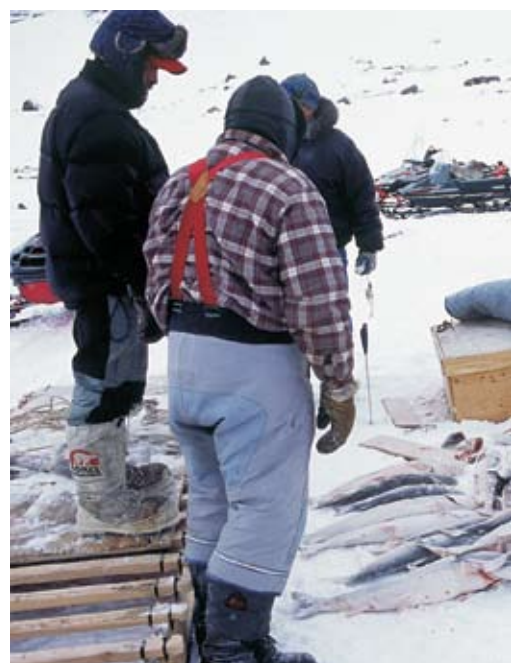
Obóz myśliwych niedaleko Camberland Sound